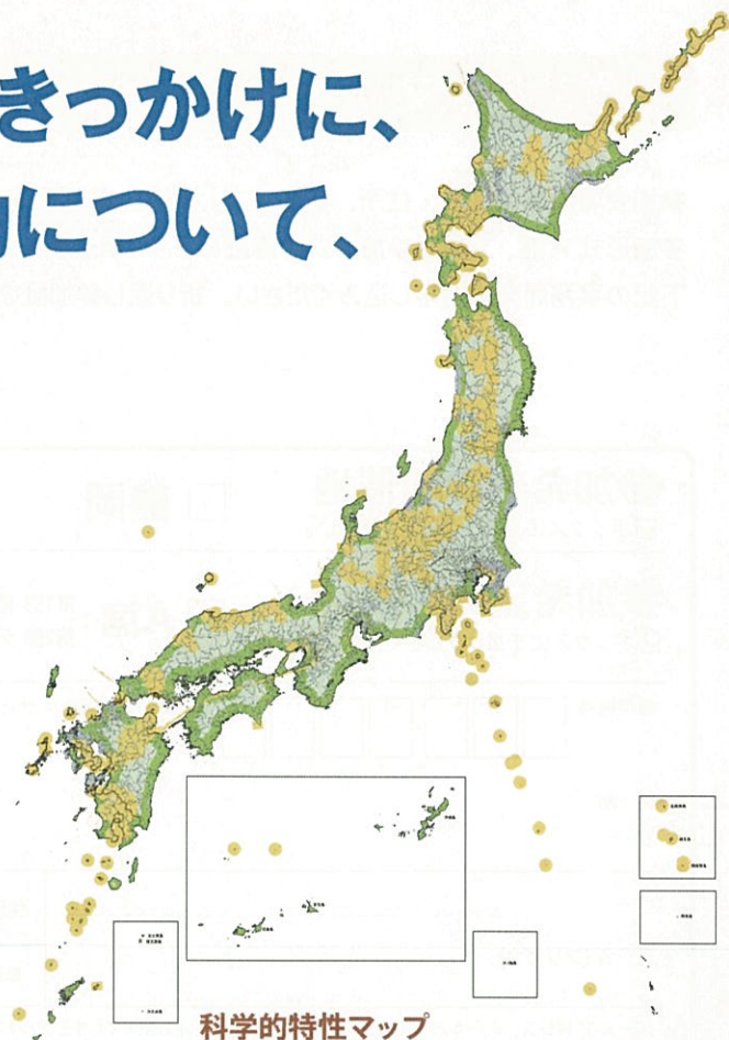
科学的特性マップ