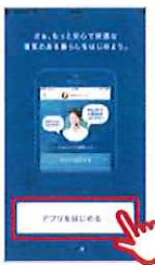
④「アプリをはじめます」を タップ