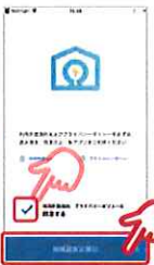
⑤「同意する」をタップし、 「地域設定に進む」をタップ