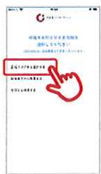
①「広域エリアから 選択する」をタップ

停電情報の配信を希望する地域を選択してください。 「広域エリア」「郵便番号」「住所」の3種類からご登録ができます。 (下記は広域エリア選択のイメージ)