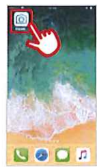
①「アイコン」をタップ

「停電情報お知らせサービス」アプリをダウンロード後、 ホーム画面のアイコンをタップして起動します。