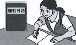
運転日誌の備付け