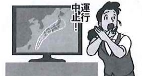
異常気象時等の措置