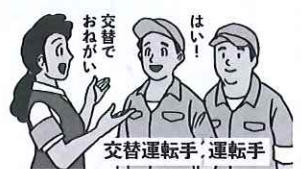
交替運転手の配置