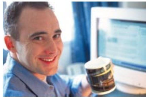
「家でパソコンに向かっているときに飲むと、リラックスで