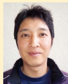
TEASEVEN協同組合 代表理事