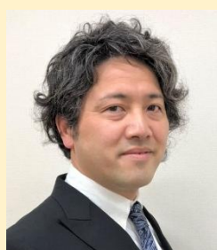
静岡県よろず支援拠点 コーディネーター