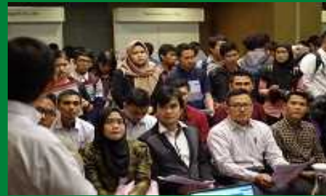
令和元年度インドネシア面接会の様子