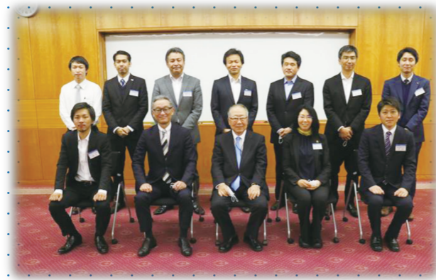
昨年度受講生の皆さん