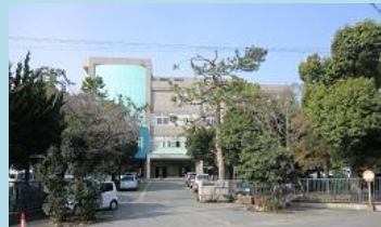
県立浜松北高校 点検組合員:東海消防技研