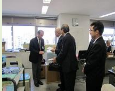
▲ 浜松市教育委員会にて