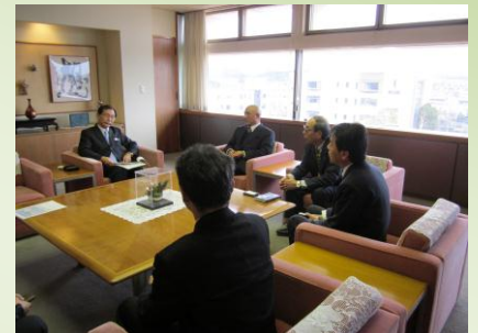
▲ 袋井市役所 市長室にて