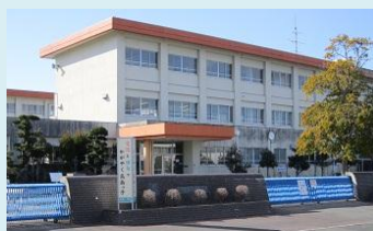
袋井市立高南小学校 点検組合員：セルコ

平成24年2月9日(木)、2月24日(金)に小田巻検査員長他で、ランダム抽出した共同受注施設の現地へ赴き、作業員資格者証や点検機材の確認等を行いました。一部で加熱試験機の校正年表示が不明確で口頭注意が為されましたが、それ以外の測定機器は適正で、作業員は全て有資格者社員でした。これからも適正点検を心掛けましょう。