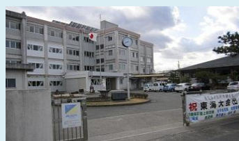
浜松市立積志中学校 点検組合員：セルコ