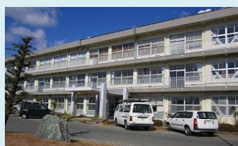
磐田市立豊田中学校 点検組合員：豊田消防設備