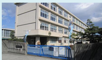
浜松市立相生小学校 点検組合員：ニッコウプロセス