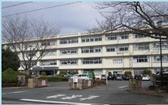
県立浜松城北高校 点検組合員:セルコ