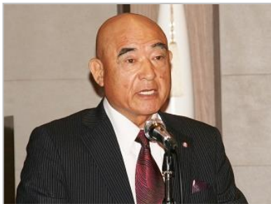
▲ 西川理事長（開会挨拶）

平成 29 年 5 月 18 日（木）午後 4 時 30 分から、静岡県消防設備保守点検協同組合「第 23 回通常総会」がご来賓、賛助会員の皆様をはじめ多数の組合員の出席（総出席者 50 名余）のもと、静岡市内（グランディエール・ブケトーカイ）で開催されました。